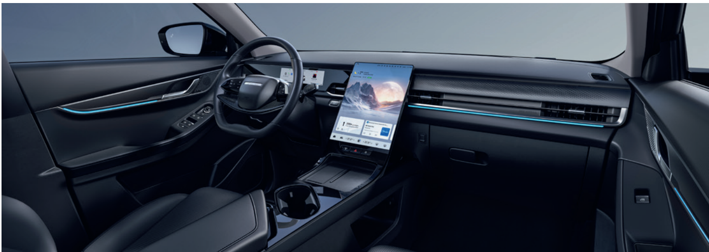
FEKETE SZINTETIKUS BŐR