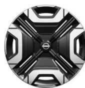
18" Iconic könnyűfém keréktárcsa