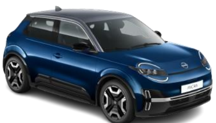
Tengerésszék / Szürke tető YWZ – 300 000 Ft

*ENGAGE felszereltség a csillaggal megjelölt színekben érhető el.