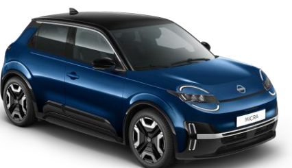
Tengerésszék / Fekete tető YWW – 300 000 Ft