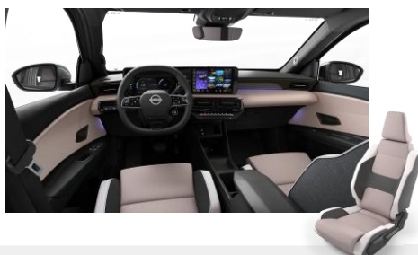
Zen belső Szövet és szintetikus bőr ülések