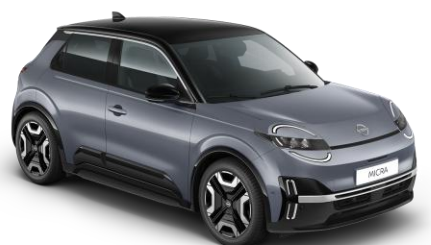
Elegánszüst / Fekete tető YUY – 300 000 Ft