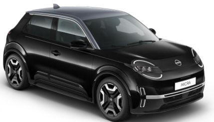
Misztikusfekete / Szürke tető YWX – 300 000 Ft