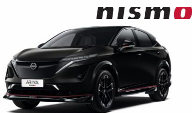
GYÖNGYHÁZ FEKETE GAT – 220 000 Ft