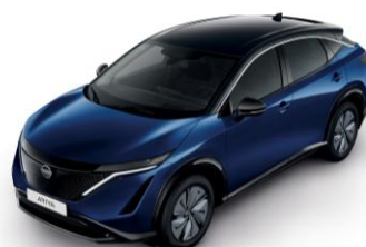
ÉJKÉK /FEKETE XGU – 410 000 Ft