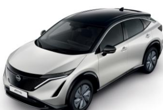
GYÖNGYHÁZFEHÉR /FEKETE XGA – 410 000 Ft