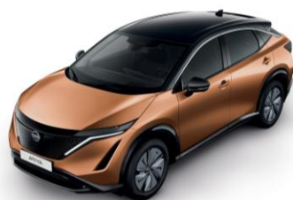
AKATSUKI RÉZ /FEKETE XGJ – 410 000 Ft