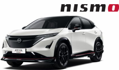
GYÖNGYHÁZFEHÉR /FEKETE XGA – 410 000 Ft