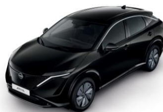
GYÖNGYHÁZFEKETE GAT – 220 000 Ft