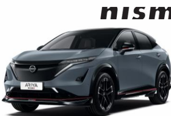
LOPAKODÓ SZÜRKE /FEKETE YAZ – 410 000 Ft