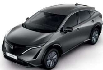
FEGYVERSZÜRKE KAD – 190 000 Ft