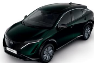
AURORAZÖLD DAP – 220 000 Ft